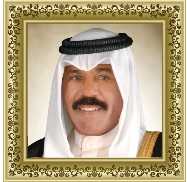
حضرة صاحب سمو الشيخ نواف الأحمد الجابر الصباح أمير دولة الكويت