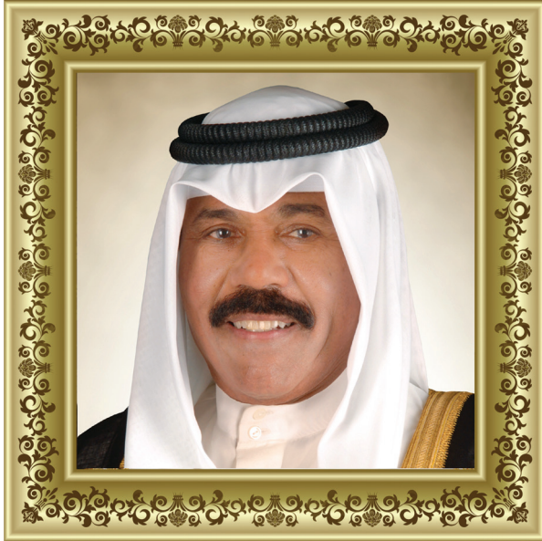
H. H. Shaikh Nawaf Al Ahmad Al Jaber Al Sabah Emir of Kuwait