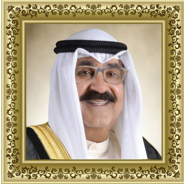
سمو الشيخ مشعل الأحمد الجابر الصباح ولي عهد دولة الكويت