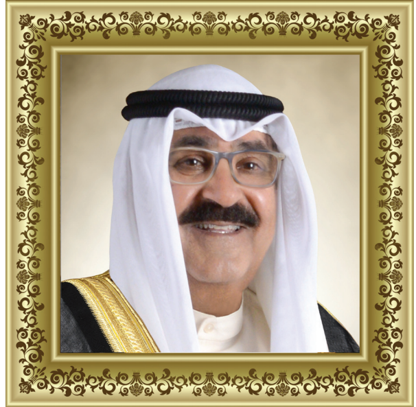
H. H. Shaikh Meshaal Al Ahmad Al Jaber Al Sabah Crown Prince